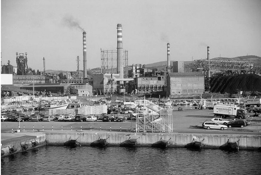
Industria en Piombino, Italia.

Información gráfica 2: Observa la siguiente imagen y responde a las preguntas que figuran a continuación: